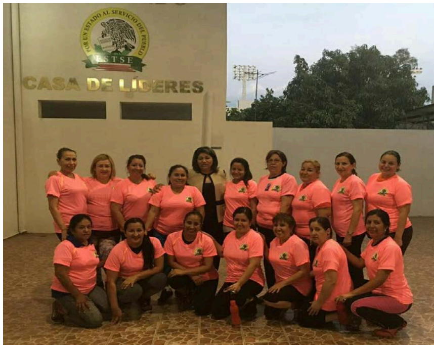
Apoyo de uniformes para mujeres interesadas en mejorar su calidad de vida, que forman parte de un grupo de zumba.