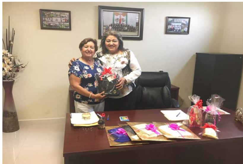
Regalos para las maestras madres de familia.